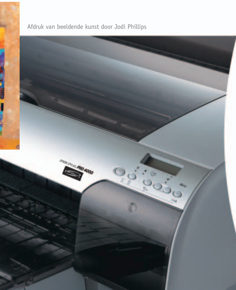
Afdruk van beeldende kunst door Jodi Phillips